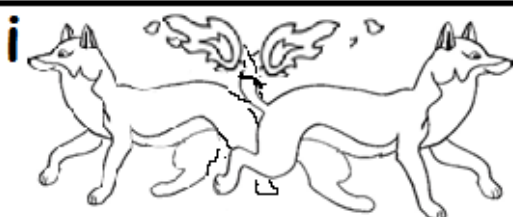
wraak: vossen in het veld