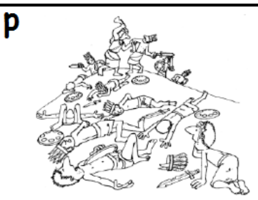
gedood met de ezelskaak